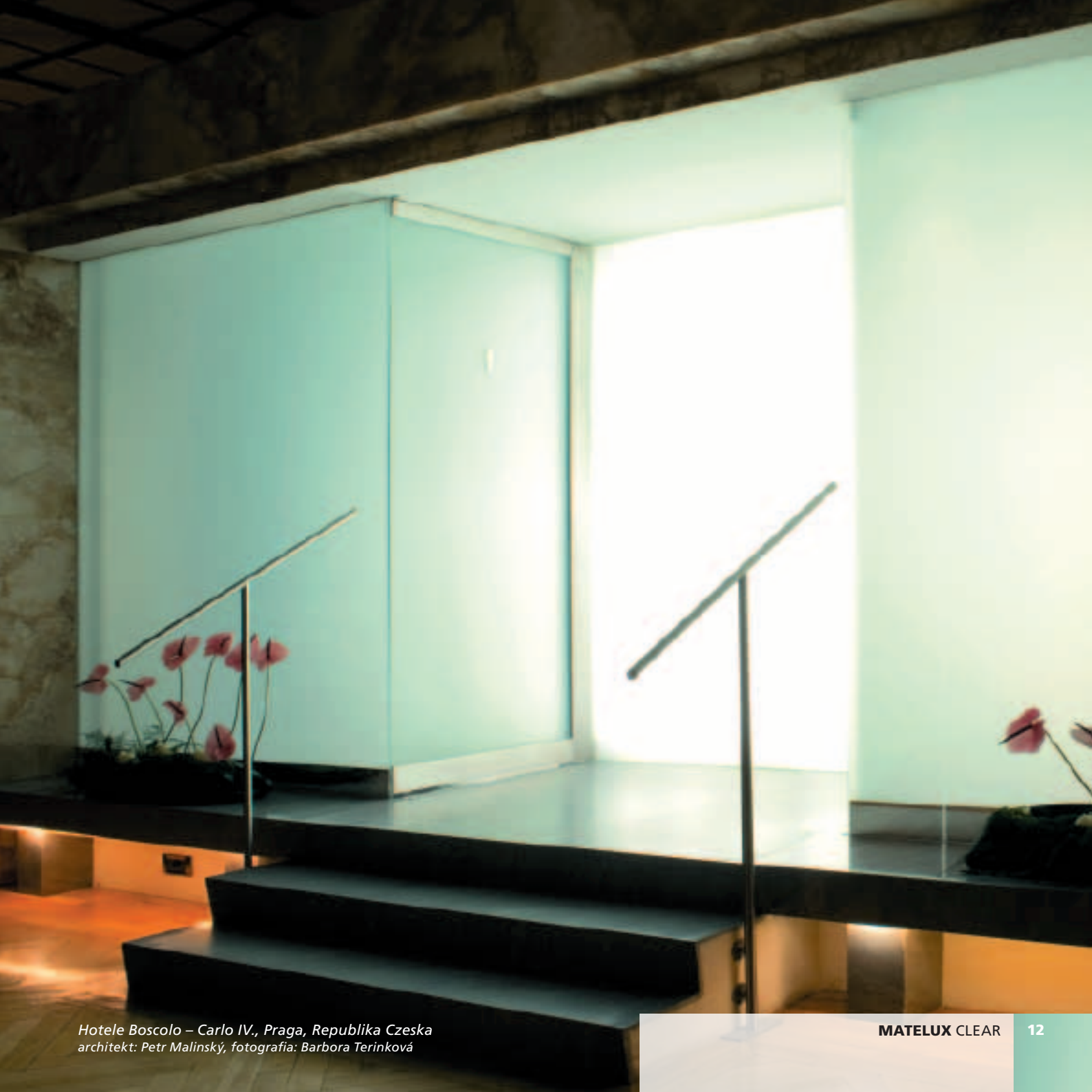
Hotele Boscolo – Carlo IV., Praga, Republika Czeska architekt: Petr Malinský