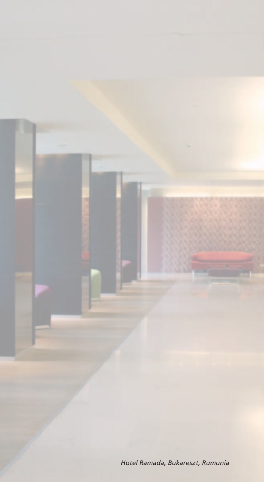
Hotel Ramada, Bukareszt, Rumunia